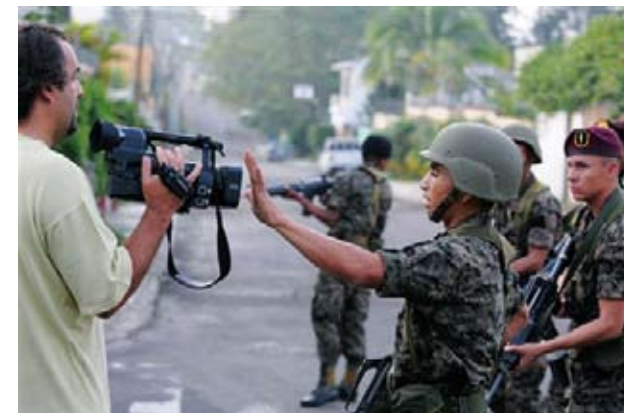
Los periodistas fueron trasladados a una jefatura policial.

En el comunicado la Relatoría Especial demanda que se garantice a todos los comunicadores y las comunicadoras sociales, con independencia de su línea editorial, la posibilidad de expresar