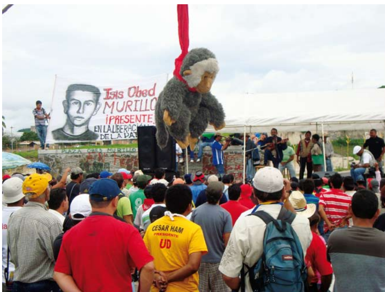
Las manifestaciones en Tegucigalpa continúan y llevan presente pancartas y monigotes en contra del gobierno de facto.

Ayer en Trujillo, Colón reprimieron una Marcha Pacífica con saldo de golpeados, detenidos y heridos por parte de los manifestantes, tanto así que un compa-